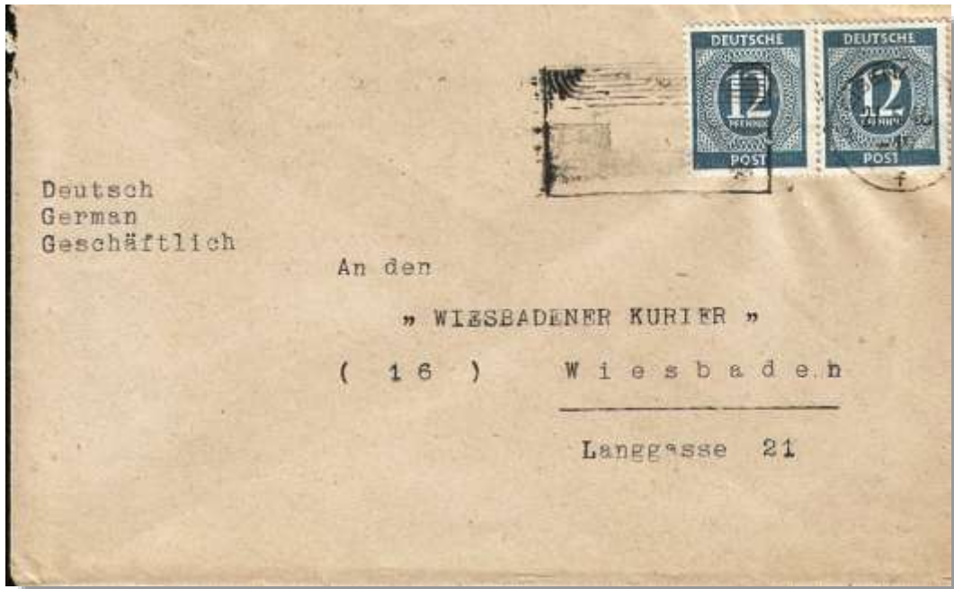
Abb. 3: Notentwertung mit Postfreistempel (15) EISENACH 2 f, 27.5.46, in schwarz (Sammlung Pabst)