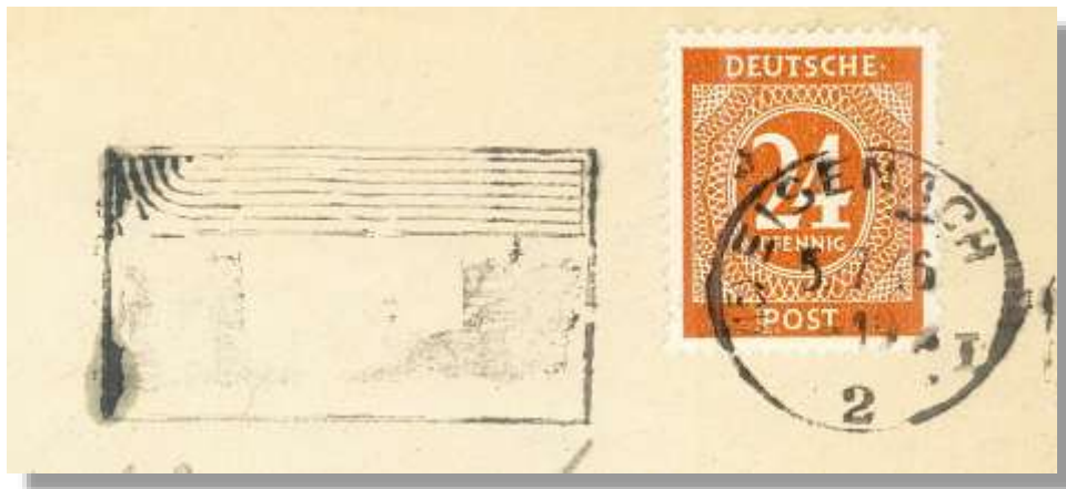
Abb. 1: Notentwertung mit Postfreistempel (15) EISENACH 2 I, 5.7.46 in schwarz

B isher war von EISENACH 2 nur die Notmaßnahme des Postfreistempels (15) EISENACH 2 I in schwarz als Entwertungsstempel auf mehreren Belegen bekannt.