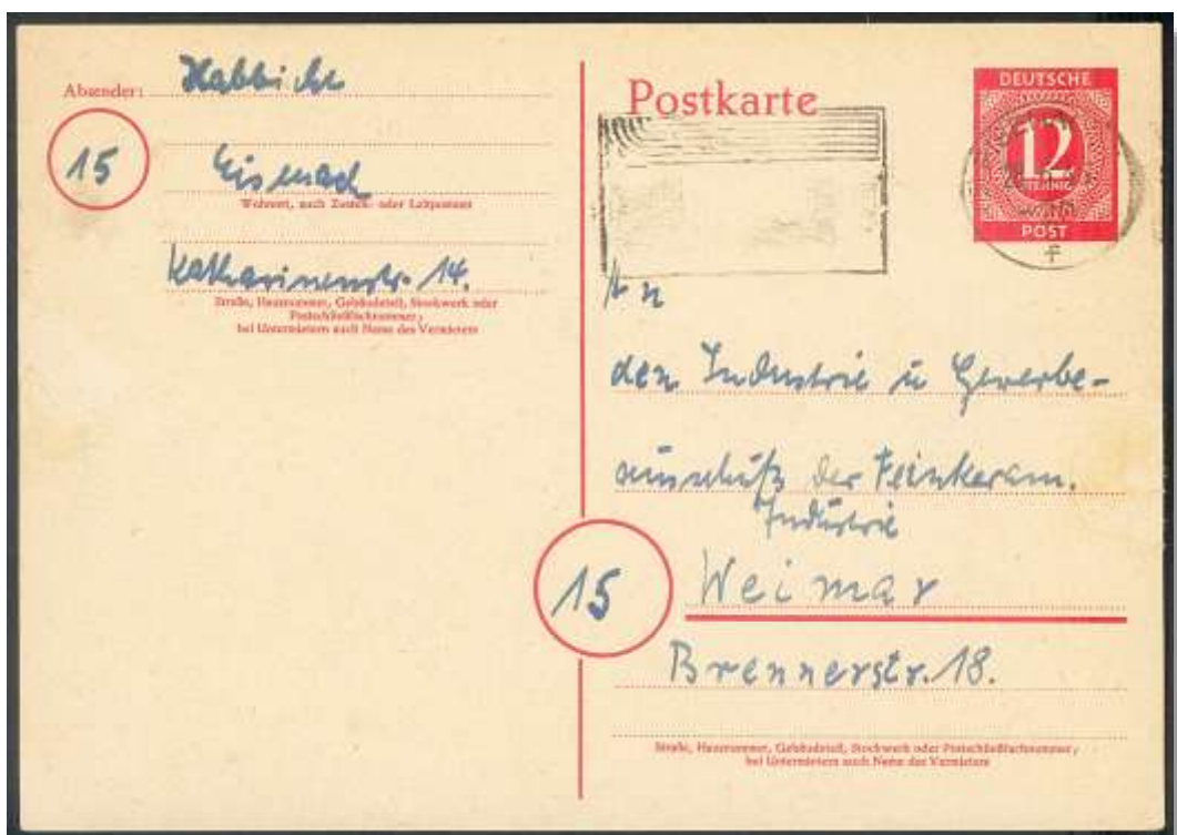
Abb. 4: Notentwertung mit Postfreistempel (15) EISENACH 2 f, 28.5.46, in schwarz (Sammlung Pütz)

Grundsätzlich liegt der aptierte Reichsadler bei beiden Notentwertungen EISENACH 2 I und EISENACH 2 f kopfstehend (Flügel oben) immer links und ist stets in schwarzer Stempelfarbe.